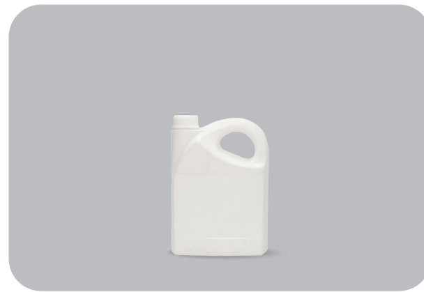
بطری ۱ لیتری دهنه ۴۵